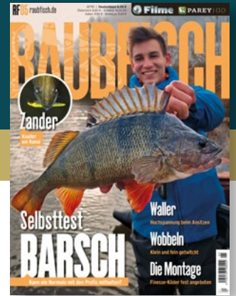
Titelbild: Max Guder