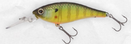
Pearl Real Blue Gill