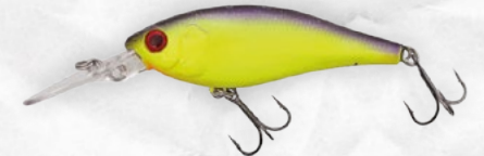
Trad Purple Chartreuse