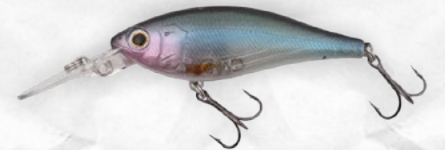
Crystal Aurora Ghost