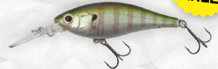
Flashing Real Blue Gill