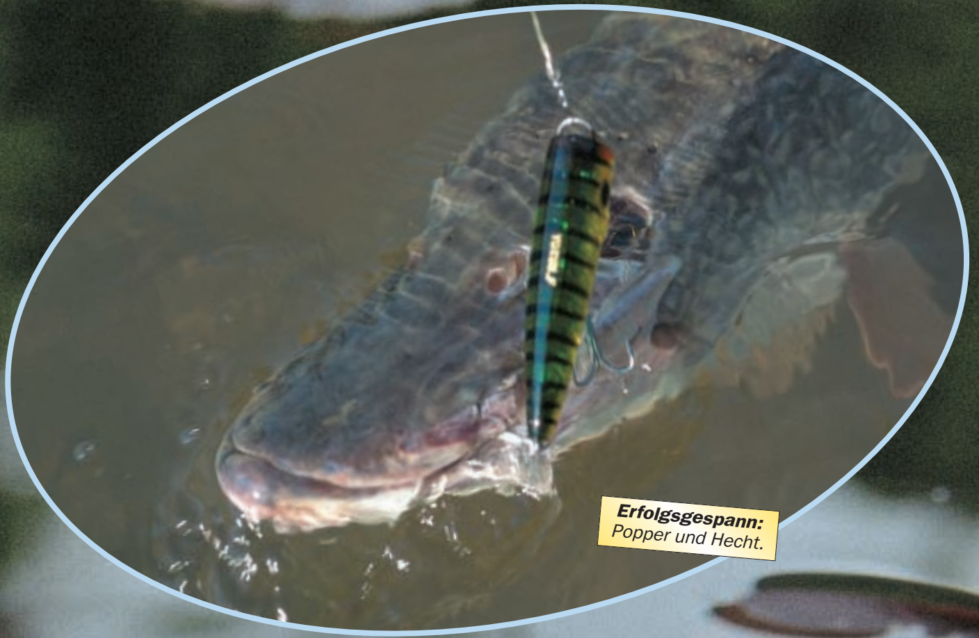
Erfolgsgespann: Popper und Hecht.