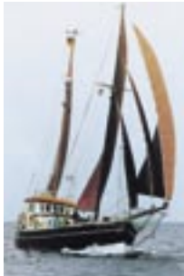
MSS „Alte Liebe“

Kapitän Dirk Reese Rügenwalder Straße 26 23774 Heiligenhafen Tel 0 43 62 / 900 813 Fax 0 43 62 / 900 812 dirk_reese@t-online.de